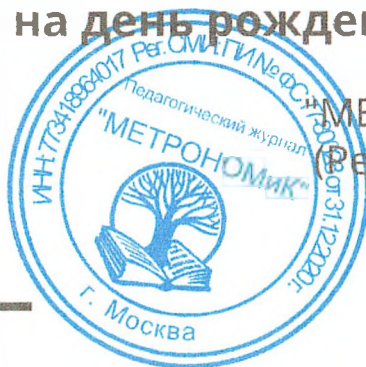
КИШИНЕВСКАЯ М.А. ГЛАВНЫЙ РЕДАКТОР

"МЕТРОНОМИК", выпуск № 4, ноябрь 2021 г. (рег. СМИ: ПИ № ФС77-80028 от 31.12.2020)